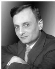
A. O. Gelfond

Como ejemplos específicos, Hilbert menciona a los números 2^{\sqrt{2}} y e^{\pi} . Es importante observar que Hilbert propuso el séptimo problema pensando en los números complejos como su universo. En este contexto, e^{\pi} es un valor de la potencia compleja i^{-2i} . En general, a^b es una expresión multivaluada, así que es más correcto decir que cualquier valor de a^b será trascendente.